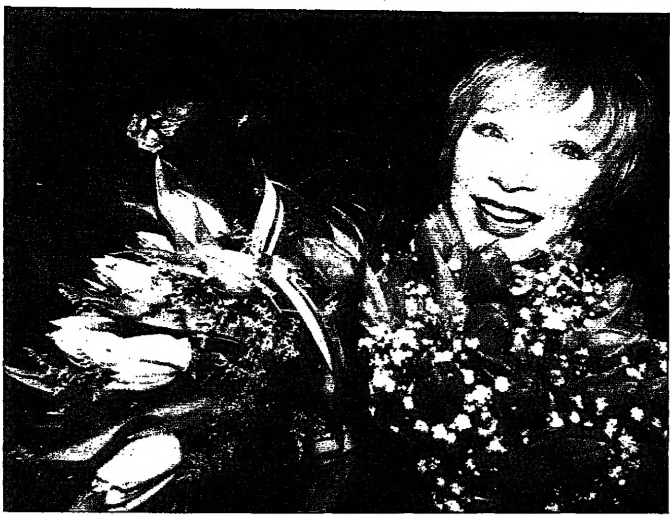
النجمة الأمريكية شيرلي ماكين شهدت حفل العرض الأول لفيلمها الجديد في وارسو قبل ان تسافر الى برلين لتسلم جائزة الكاميرا الذهبية من مهرجان برلين

أكدت نتائج أبحاث طبية جديدة ان النساء اللواتي يتعرضن لعمليات اجهاض متكررة من أكثر عرضة لاصابة بالاكتئاب، وكانت الأبحاث أجراها فريق من الاختصاصيين الأمريكيين برئاسة الدكتور ريتشارد نوجيوير من معهد نيويورك للطب النفسي، قد شملت دراسة لـ 100 امرأة عانت من حالات الحمل المتكرر في الأشهر الأولى بعد فقد الجنين خاصة النساء اللواتي لا اولاد لهن أو من لهن تاريخ من اضطرابات الاكتئاب الرئيسية، يتكرر ان ما بين 20-30 في المئة من حالات الحمل لتتلى بالاجهاض في الولايات المتحدة، وطبقا للدراسة فإن 10.9 في المئة من النساء اللواتي اجهن امين باحباط واكتئاب شديد، بينما تأثر 3.4 في المئة بالاكتئاب بعد الشهر الأول من فقد الجنين.